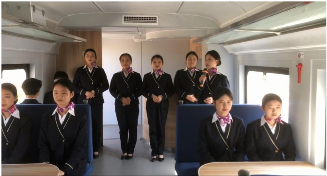
附件四 合作高校及企业（火车站、地铁、高铁、酒店）